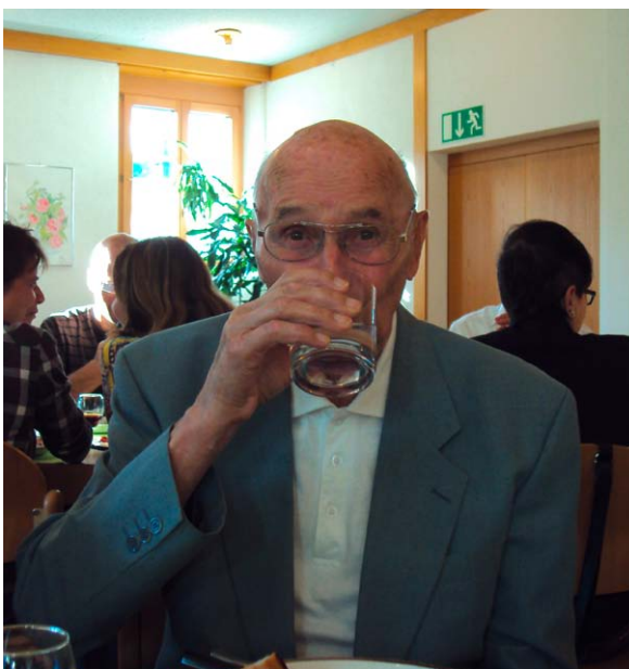
Auf die Gesundheit