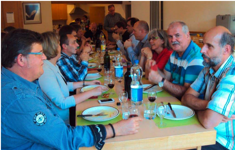
Gemütliches Beisammensein bei Schinkli im Teig und Salat