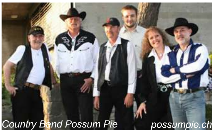
Country Band Possum Pie

Wie enthüllen wir zum ersten Mal unsere neue Vereinsfahne vor der Öffentlichkeit? Wie präsentieren wir uns dem Publikum erstmals mit unserer neuen Uniform? Diese und viele andere Fragen stellen sich zur Zeit die Organisatoren der bevorstehenden Uniform- und Fahnenweihe. Die Details sind noch nicht alle geklärt, aber eines ist sicher: Wir wollen das Festwochenende am Freitagabend 3. Juni 2011 mit einem Paukenschlag eröffnen. Das heisst mit einer abwechslungsreichen Unterhaltungsshow für Jung und Alt und mit einem Festzelt, das zum tanzen und feiern einlädt. Mitwirken werden unter anderem unsere befreundeten Musikvereine aus Aesch und Blauen, der Jodlerclub Mis Dörfli und natürlich der Musikverein Duggingen selbst. Für gute Stimmung und eine volle Tanzbühne werden auch Reto Wicki und Huby Thalmann vom Duo Alpenpower sorgen. Ob Schlager, Party-Hits, Rockklassiker oder Volkstümliches, die zwei Vollblutmusiker haben für jeden etwas im Repertoire. Und weil das Ganze auch ein Dankeschön an die Dugginger Bevölkerung für deren Treue und Unterstützung sein soll, ist am Freitagabend für alle der Eintritt frei!